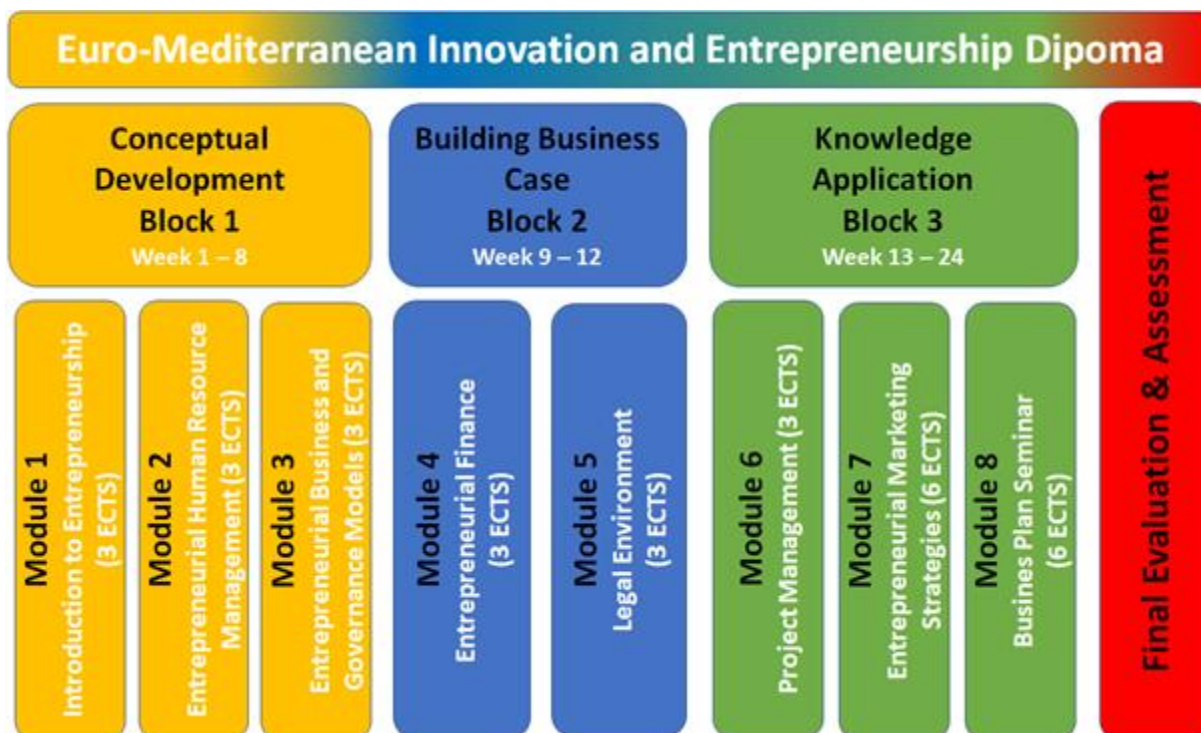
Graf 5.6.2.1.: Struktura študijskega programa za izpopolnjevanje: Diploma iz Evro-sredozemskega podjetništva in inovacij (EMIE)

Zadnji trije predmeti bodo Seminar za vodenje projektov, Strategije podjetniškega trženja in Poslovni načrt ter predvidoma dva do trije obiski na terenu. Končna ocena in evalvacija se bodo izvajali tudi kot kombinirano učenje od 14. junija 2021 do 27. avgusta 2021 z obdobjem v živo na EMUNI Univerzi v juniju oz. juliju.